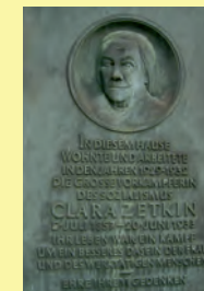
Clara Zetkin Gedenktafel