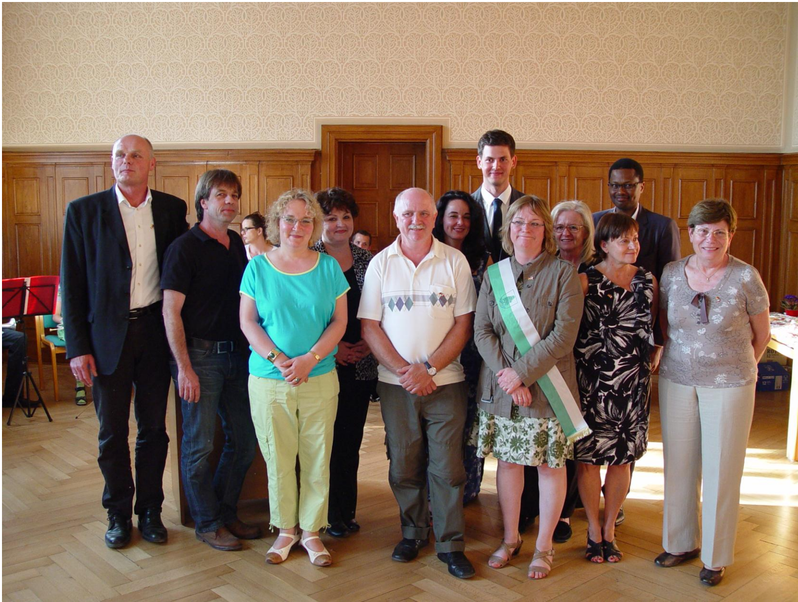
Wiederbelebung der Partnerschaft – Eine französische Delegation besuchte, nach längerem Stillstand der Partnerschaft, Birkenwerder im Mai 2012.