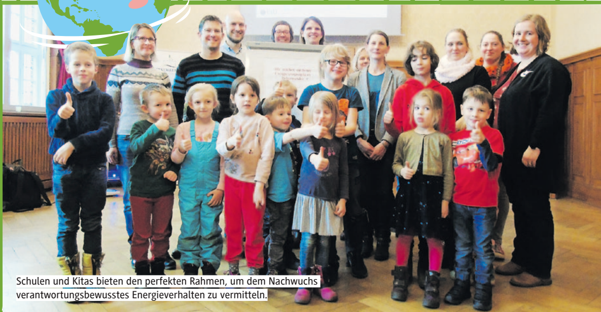
Schulen und Kitas bieten den perfekten Rahmen, um dem Nachwuchs verantwortungsbewusstes Energieverhalten zu vermitteln.