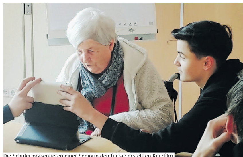
Die Schüler präsentieren einer Seniorin den für sie erstellten Kurzfilm.

Schon traditionell fand das Projekt „Biografien werden lebendig“ mit Jugendlichen der 8. Klassen der Dr. Hugo Rosenthal Oberschule und Seniorinnen im Seniorenpflegeheim des ASB in Hohen Neuendorf statt.