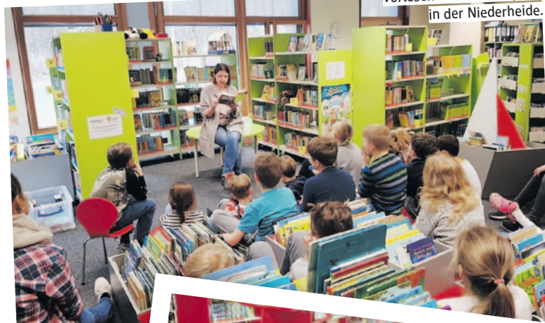
Vorlesen mit der Lesepatin in der Niederheide.