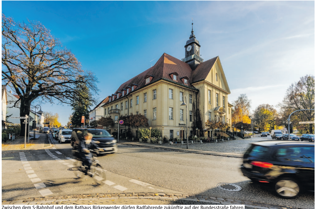
Zwischen dem S-Bahnhof und dem Rathaus Birkenwerder dürfen Radfahrende zukünftig auf der Bundesstraße fahren.

➔ Viele weitere aktuelle Informationen bieten die Internetseiten www.oberhavel.de/coronavirus sowie www.rki.de (Robert-Koch-Institut) und www.bzga.de (Bundeszentrale für gesundheitliche Aufklärung).