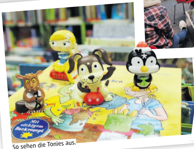
So sehen die Tonies aus.