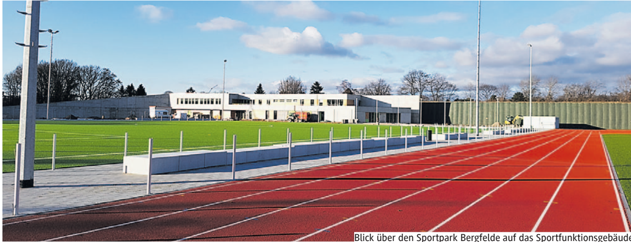
Blick über den Sportpark Bergfelde auf das Sportfunktionsgebäude.