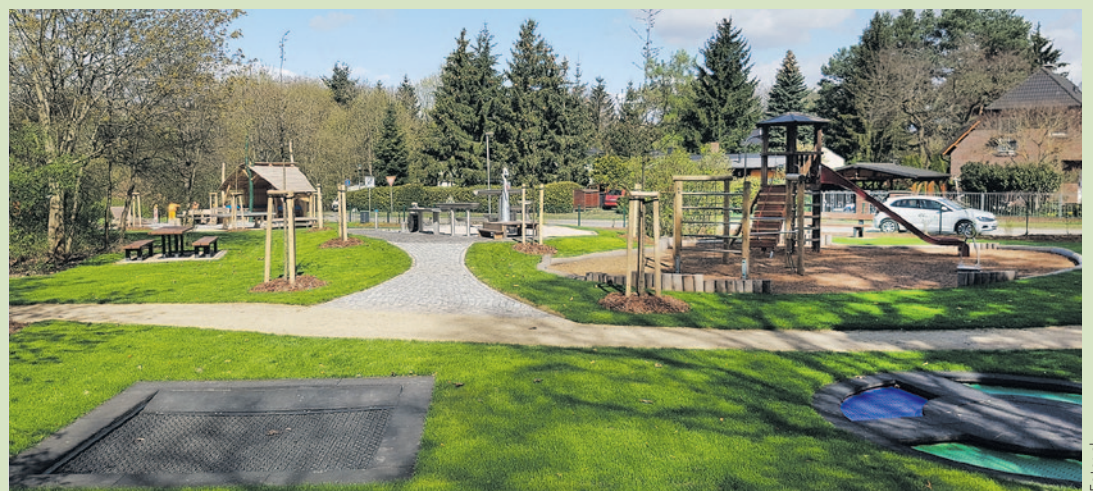
Der neu gebaute Wasserspielplatz mit angrenzendem Radwander-Rastplatz .