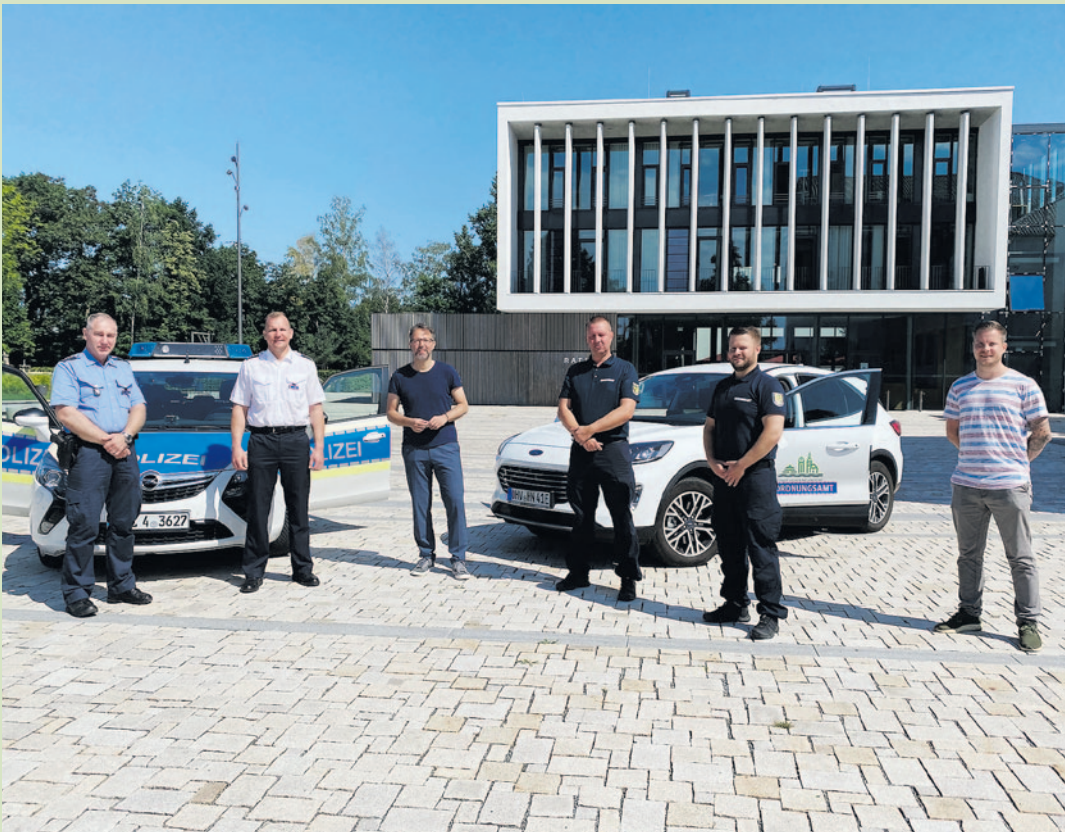
Ordnungsamt und Polizei arbeiten in Hohen Neuendorf eng zusammen .