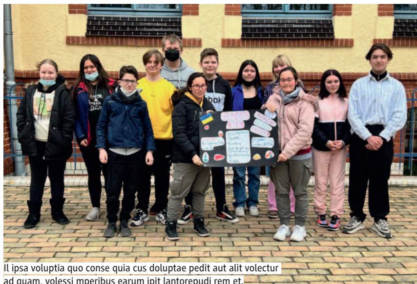
Il ipsa voluptua quo conse quia cus doluptae pedit aut alit volectur ad quam, volessi mperibus earum ipit lantorepudi rem et.