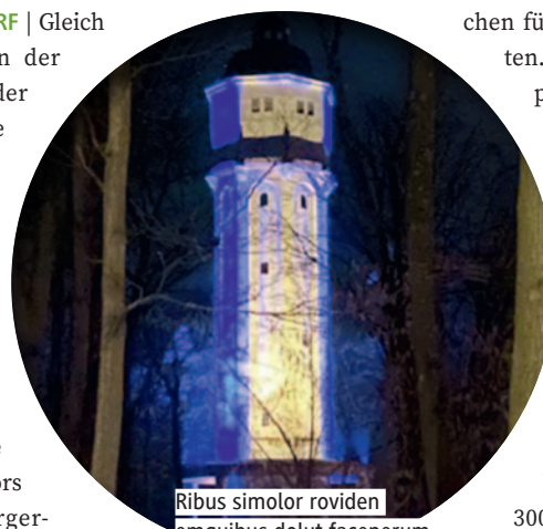
Ribus simolor roviden emquibus dolut faceperum facea eum eve