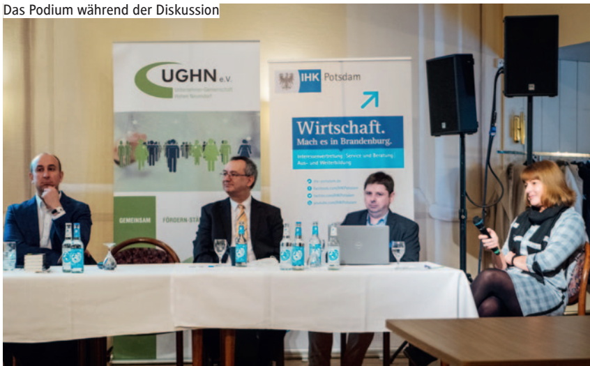
Das Podium während der Diskussion

➔ Eine erweiterte Fassung des Textes mit ergänzenden Informationen hat der UGHN auf https://ughn.de/veroeffentlicht .