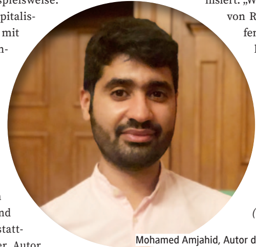
Mohamed Amjahid, Autor des Buches „Der weiße Fleck – eine Anleitung zu antirassistischem Denken“, bei der Lesung am 01.10.21 im Rathaus Birkenwerder.

inhaltet das Buch auch 50 Tipps, sich im Alltag antirassistisch zu verhalten. Der Autor erklärt beispielsweise: „Wir leben im Kapitalismus, wir können mit unserem Konsumverhalten steuern. Es gibt für alles auch eine diskriminierungsfreie Alternative.“ Wichtig sei vor allem, dass jegliches (antirassistisches) Handeln stets solidarisch und auf Augenhöhe stattfindet, betonte der Autor mehrfach. „Die Kunst ist es, auszuhalten nicht immer im Zentrum des Universums zu stehen. Und einfach zuzuhören.“