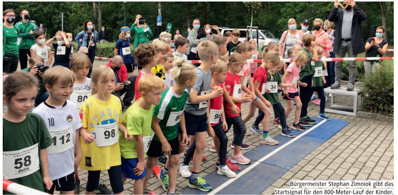
Bürgermeister Stephan Zimniok gibt das Startsignal für den 800-Meter-Lauf der Kinder.

Um 11 Uhr gab Bürgermeister Stephan Zimniok das Startsignal für den ersten Lauf, den 400-Meter-Lauf der 4- und 5-Jäh-