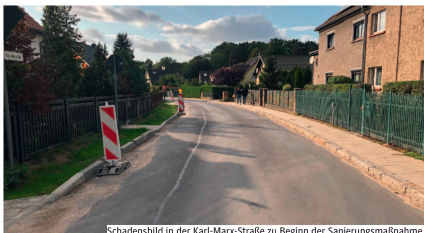
Schadensbild in der Karl-Marx-Straße zu Beginn der Sanierungsmaßnahme.

Durch die Grunderneuerung ist die gefahrlose Befahrung nun wieder möglich. Zudem ist das eingesetzte Material hitzebeständiger als die vorherige Deckschicht. (Text: din)