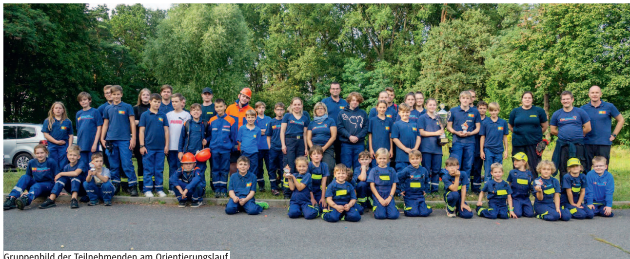
Gruppenbild der Teilnehmenden am Orientierungslauf.

HOHEN NEUENDORF | Lange musste auf Präsenzveranstaltungen bei der Kinder- und Jugendfeuerwehr verzichtet werden, viele gemeinsame Aktionen konnten aufgrund der Corona-Situation seit dem Frühjahr letzten Jahres nicht stattfinden. Umso größer war die Freude, dass endlich der Orientierungslauf mit allen Kinder- und Jugendgruppen am Samstag, den 4. September, durchgeführt werden konnte. Spannende Aufgaben, Rätsel, viel Spaß und eine rund acht Kilometer lange Strecke rund um Borgs-