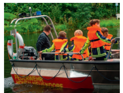
Einsatz des Bootes aus dem Löschzug Bergfelde.

➔ Möchtest Du auch zur Kinder- und Jugendfeuerwehr? Mädchen und Jungen ab der Einschulung sind stets willkommen, bei den Kinder- und Jugendgruppen Hohen Neuendorf, Bergfelde und Borgsdorf vorbeizuschauen und bei der Jugendfeuerwehr mitzumachen. Auf unserer Homepage https://feuerwehr.hohen-neuendorf.de findest Du weitere Informationen und Kontakte.