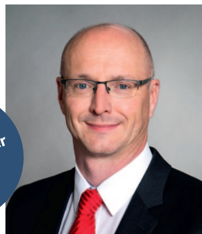
Landrat Ludger Weskamp (SPD) legt sein Amt nieder und wird Präsident des Ostdeutschen Sparkassenverbandes.

Sonntag, den 28. November 2021, zwischen 8 Uhr und 18 Uhr statt. Wahlberechtigte erhalten wieder im Vorfeld ihre Wahlbenachrichtigung per Post. Aber auch ohne diese ist es möglich, am Wahltag bei