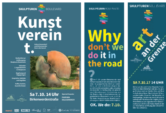
Poster und Handouts zur Bewerbung der ersten Ausstellung auf dem Skulpturen Boulevard, August/September 2017

Dies wird in dem Pilotprojekt von Bürgern für Bürger zum Nachahmen angeregt auf einer Kunst-Straße zwischen der Gemeinde Birkenwerder und der Stadt Hohen-Neuendorf im Norden von Berlin. Dieser öffentliche Raum mitten im Grünen, räumlich attraktiv definiert durch zahlreiche Beiträge regionaler und international bekannter Künstler und die programmatische Vielsprachigkeit ganz unterschiedlicher Auffassungen von Skulptur, verbindet