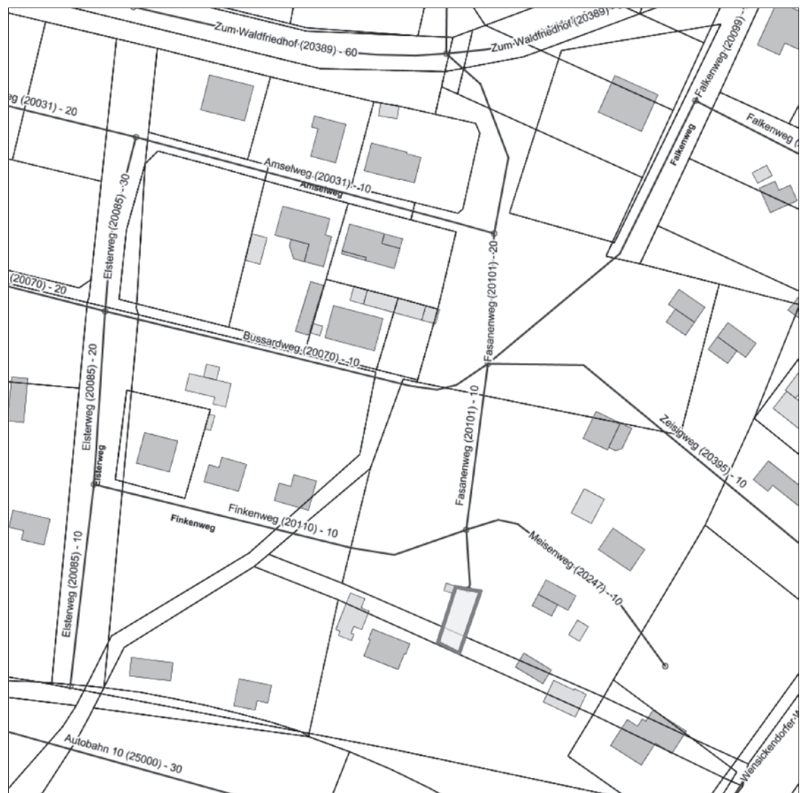
Übersichtsplan: Einziehung eines Teilstücks vom Fasanenweg