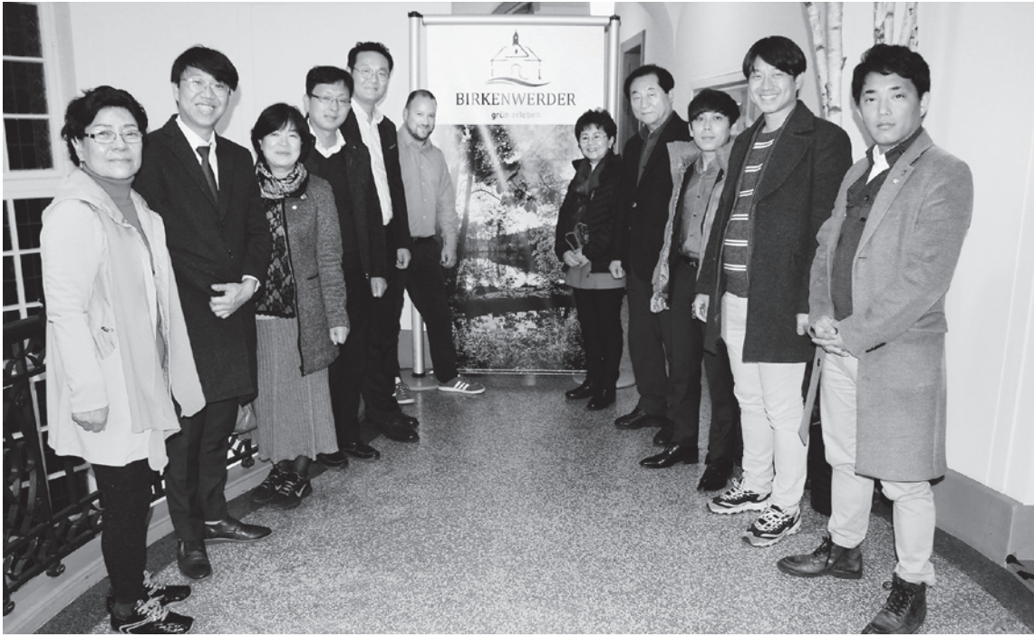
Bürgermeister Stephan Zimniok empfängt Gäste aus Südkorea im Rathaus Birkenwerder und bringt ihnen die politischen Strukturen der Gemeinde näher. Die asiatischen Stadträte und Journalisten konnten viele Fragen stellen.