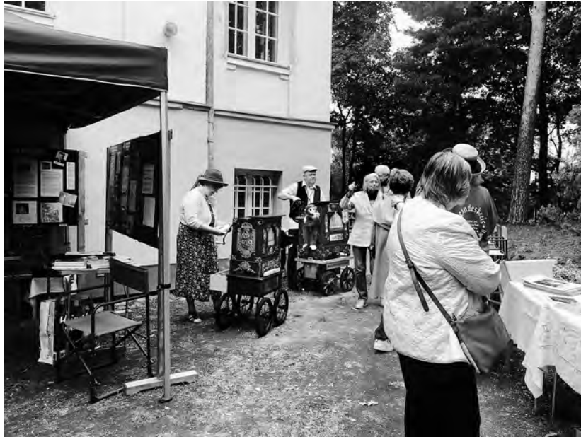
Das Sommerfest der Geschichtsstube am 27. August war gut besucht.